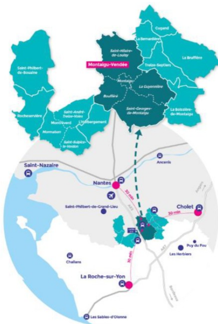
Situation et territoire de Terres de Montaigu

L'élaboration du présent projet de plan climat air énergie territorial (PCAET) engagé suite à la délibération de la collectivité en date du 19 février 2018 a été accompagnée d'une évaluation environnementale en application des articles L122-4 et R122-17 du code de l'environnement .